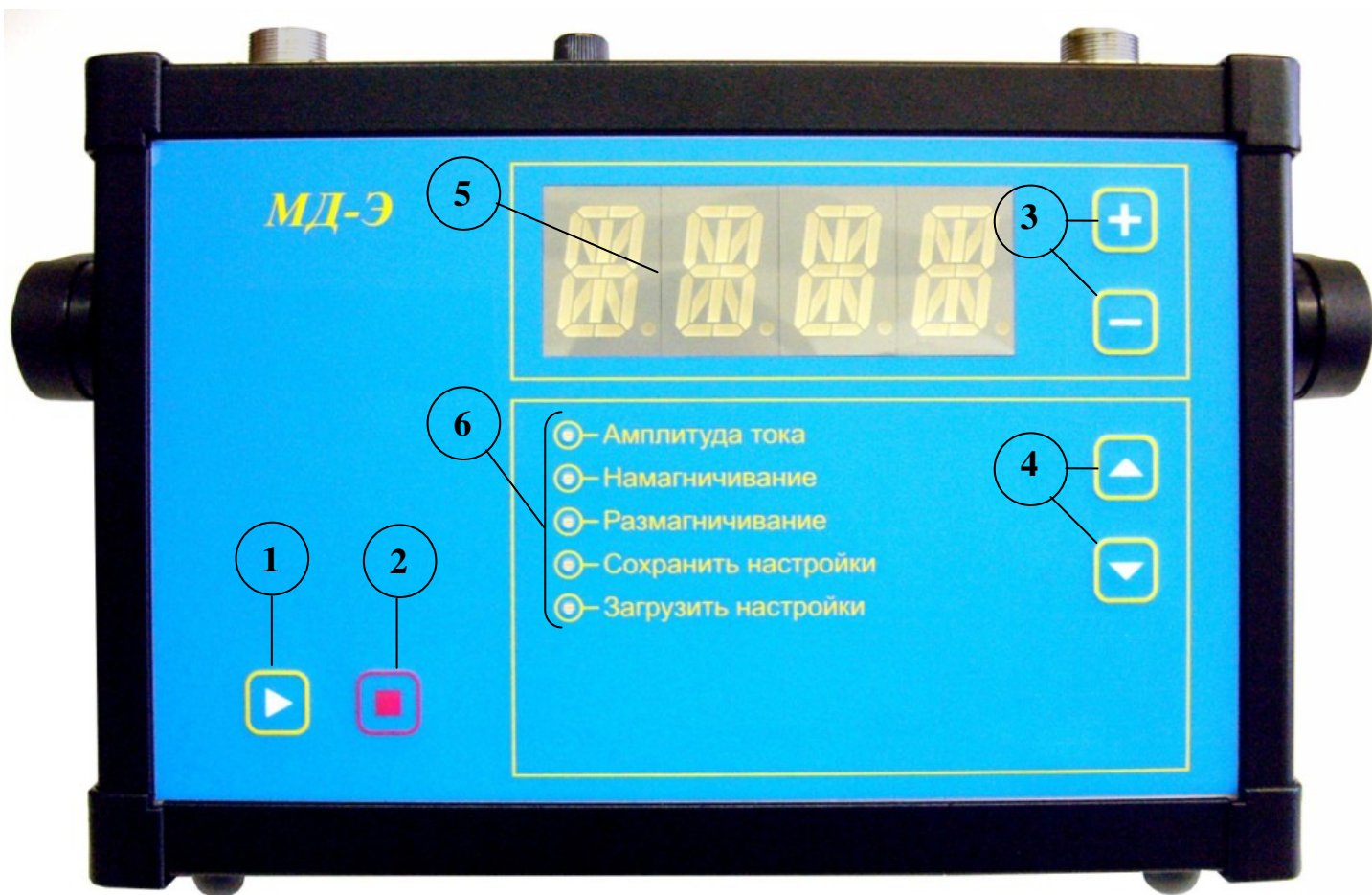
Рисунок 4.2 Передняя панель дефектоскопа МД-Э:

1 - кнопка «ПУСК»; 2 - кнопка «СТОП»; 3 - «+», «-» увеличение и уменьшение тока; 4 - кнопка выбора пунктов меню; 5 - цифровой индикатор; 6 - меню.