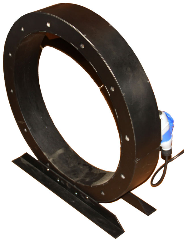
Рисунок 4.4 Внешний вид катушки Э600

С целью создания продольного магнитного поля в комплект модуля входит соленоид с диаметром отверстия 600 мм. Соленоид рассчитан на работу с прибором СМ-30М в режиме длительного включения с током до 15 А (25 А- не более 10 минут).