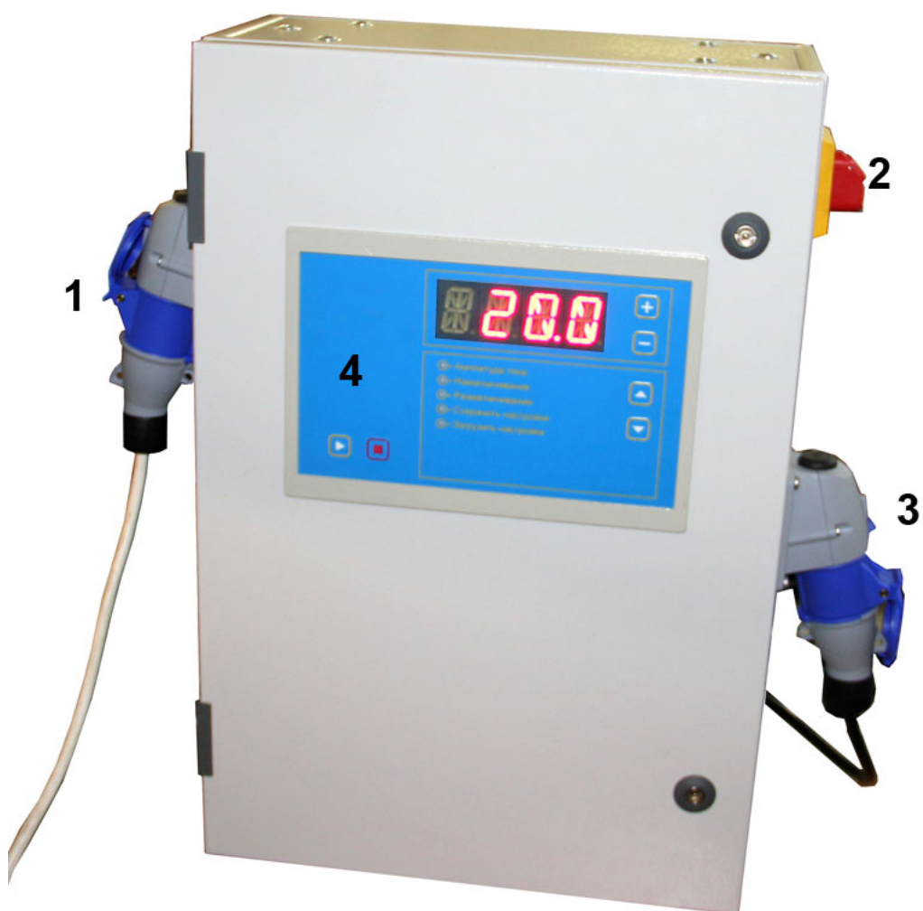
Рисунок 4.2 Внешний вид прибора СМ-30М